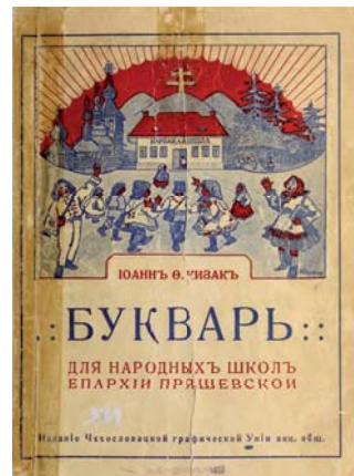
Obálka čítanky pre národné školy v Prešovskej eparchii z roku 1921.

Rusínska abeceda je ako tajný kód – keď sa ju naučíš, otvorí sa ti dvere k piesňam, rozprávkam a príbehom, ktoré si Rusíni odovzdávajú celé generácie.