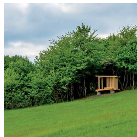
Vyhliadka v Kalnej Roztoke.

Ďakujeme starostom za spoluprácu, architektom zo štúdia Štofira architekti v Snine za dizajn a firme DCL Partner, s.r.o. za realizáciu. ■