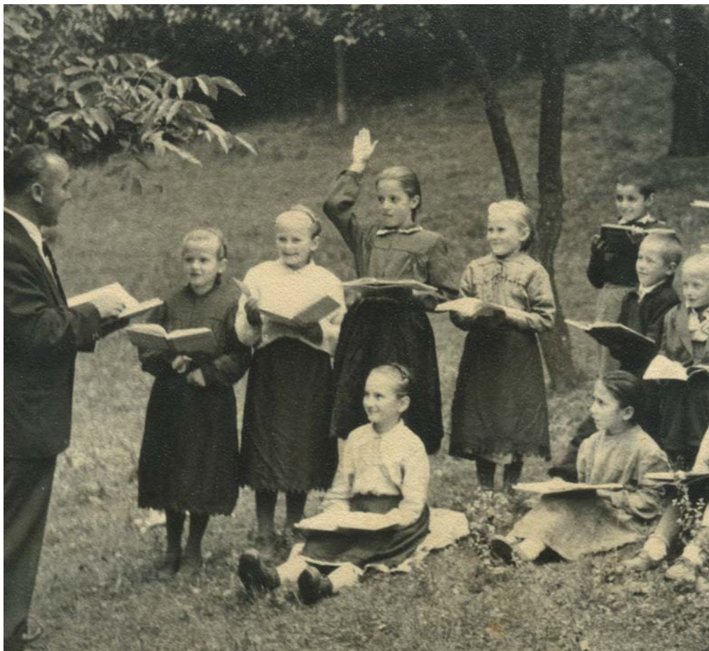
Rusínske deti v obci Renčišov počas vyučovania v sade pri škole, 50. roky 20. storočia.