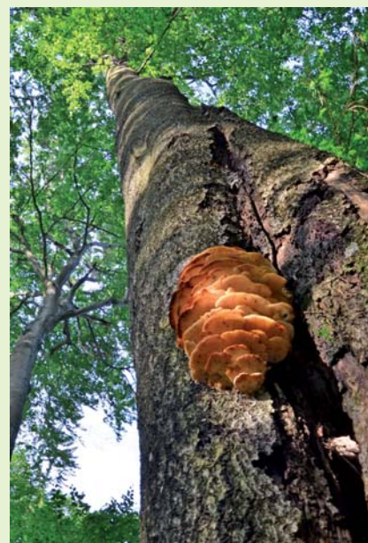
Zubček severský ( Climacodon septentrionalis )

Okrem bežne zbieraných húb však tunajšie rozľahlé lesy ukrývajú aj omnoho vzácnejšie a chránené druhy. Z tých najnápadnejších, ktoré možno pri prechádzkach v národnom parku