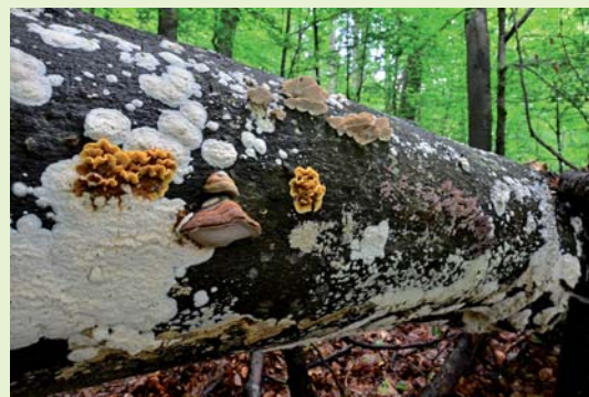
Druhá rozmanitosť húb na mŕtvom dreve

Na kmeňoch listnáčov možno v tunajších lesoch v lete nájsť nápadný širovec obyčajný či hlivu bukovú a ne-